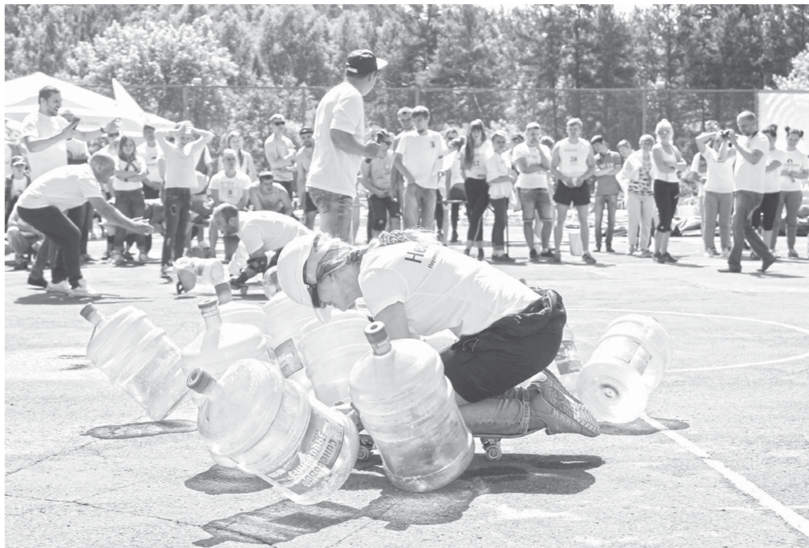
И участники соревнований, и болельщики получили массу удовольствия.

На участие в офисном боулинге каждая из команд делегировала троих представителей, которые в эстафете не участвовали. Одному из них – человеку-ядру – выдали каску и посадили на скейтборд, а двое других разгоняли этот импровизированный шар,