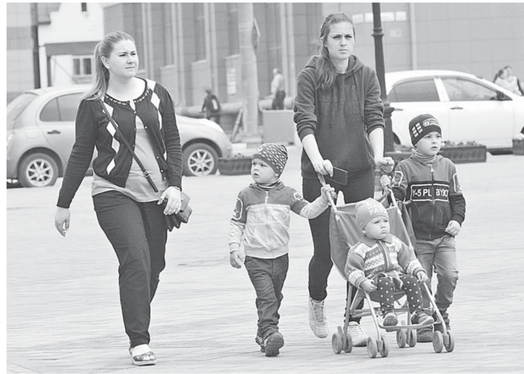
Количество многодетных семей в Барнауле с каждым годом растет.

Также в 2011 году администрация Алтайского края приняла решение о выплате единовременного пособия при рождении одновременно