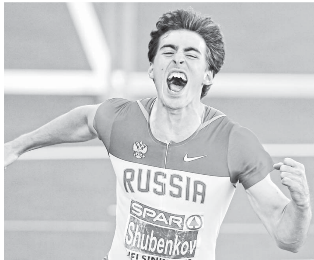
Копилка спортивных наград Сергея Шубенкова пополнилась еще одним золотом.