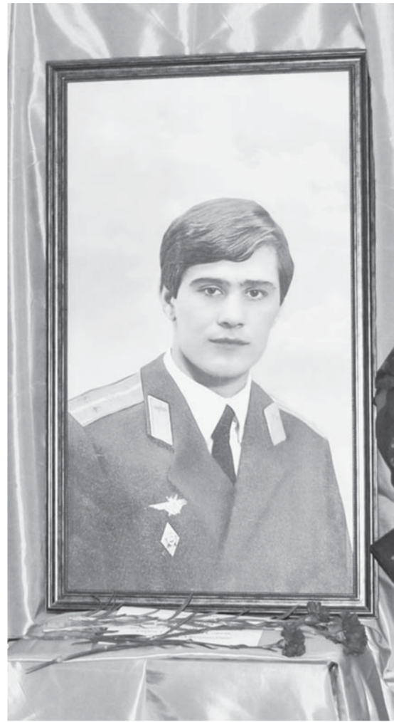
Гимназисты гордятся подвигом земляка.