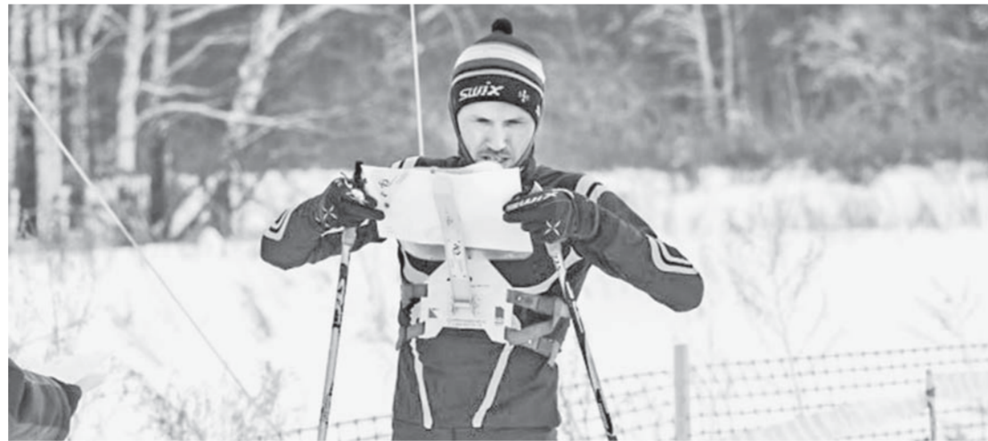
Найти в заснеженном лесу контрольный пункт – дело непростое.

Все три призовых места в чемпионате СФО как в женских, так и в мужских соревнованиях выиграли красноярцы. По итогам состязаний на маркированной трассе 20 января на